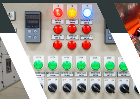
MESAS DE COMANDO