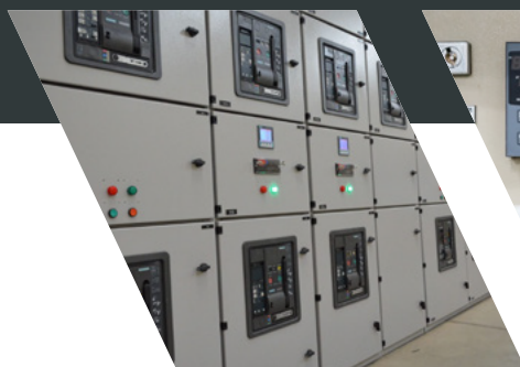
PAINÉIS DE MÉDIA E BAIXA TENSÃO