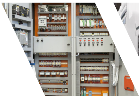
PAINÉIS DE PROTEÇÃO E CONTROLE