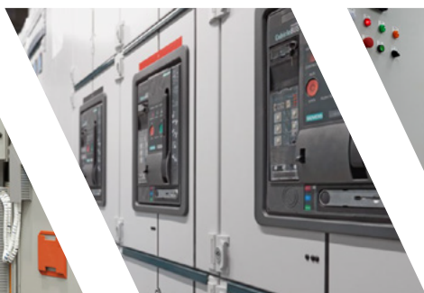
SUBESTAÇÕES CUBÍCULO DE MT + TRANSFORMADOR + PAINEL DE BT