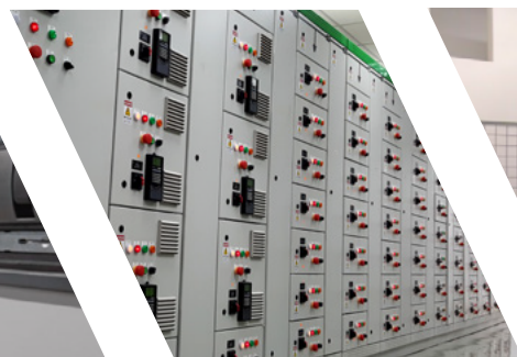
CENTROS DE CONTROLE DE MOTORES GAVETAS FIXAS E EXTRAÍVEIS